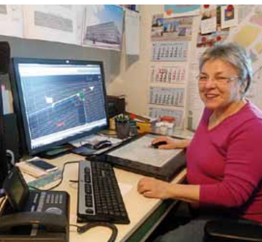
CAD-Arbeitsplatz mit einer kompetenten Planerin für Fassadentechnik 2016.

Je größer die Objekte wurden, umso umfangreicher gestalteten sich die Planungen und Ausführungen der Fenster, Türen und großen Fassaden. Auch die Anforderungen an die Konstruktionen wuchsen. Die Entwicklung im Metall-Fassadenbau hat in den letzten Jahren einen großen Zuwachs aus anderen Gewerken erfahren, sei es Statik, Bauphysik und hier die Beachtung der Energieeinsparverordnungen, oder Sonnenschutz, Brandschutz, Arbeitsstättenverordnungen, Elektrokomponenten an Türen und Fenstern, und viele neue Richtlinien und DIN-Normen aus Deutschland und der Europäischen Union. Um allen Ansprüchen an Metall-Glasfassaden gerecht zu werden, wurde es notwendig, dem Architekten Fachplaner zur Seite zu stellen. Heute sind das außer dem Statiker auch Bauphysiker, Schallgutachter, Brandschutzgutachter und der Fassadenplaner. Obwohl heute die Fassadenplanung ein Schlüsselgewerk darstellt, wird es noch immer nicht real in die offiziellen HOAI Leistungsbilder eingeordnet.